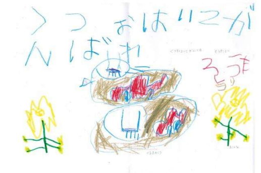
「靴を履いてがんば」